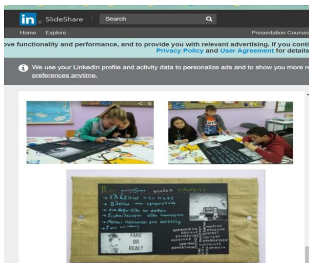
Εικόνα 1: Κριτική προσέγγιση διαφημίσεων

Αρχικά ενημέρωσα τα παιδιά ότι θα προσπαθήσουμε να γίνουμε "κριτικοί βίντεο" για να τους προσελκύσω το ενδιαφέρον και να τα παρωθήσω να γίνουν πιο παρατηρητικοί με το βίντεο. Δεν αναφέρθηκαν, ωστόσο, στο "κρυφό" μήνυμα που σχετίζεται με τον ρόλο της ΕΥΔΑΠ, κάτι που συζητήσαμε στη συνέχεια, συνδέοντάς το με τον παραγωγό και τον σκοπό του μηνύματος Όλο το σχέδιο διήρκεσε ένα δίωρο, αλλά στην πραγματικότητα αισθανθήκαμε ότι θα μπορούσαμε να το διευρύνουμε κι άλλο, κάτι που αναφέρθηκε κι από τα παιδιά για μελλοντικές δράσεις, καθώς αισθάνθηκαν πιεσμένα από τη στενότητα του χρόνου. [...] Εν κατακλείδι, θεωρώ το "πείραμα" πετυχημένο και πιστεύω ότι στάθηκε αφορμή να αρχίσει η ... "εκπαίδευση" των παιδιών πάνω στα Μέσα, με μελλοντικές δράσεις στα ... σκαριά!