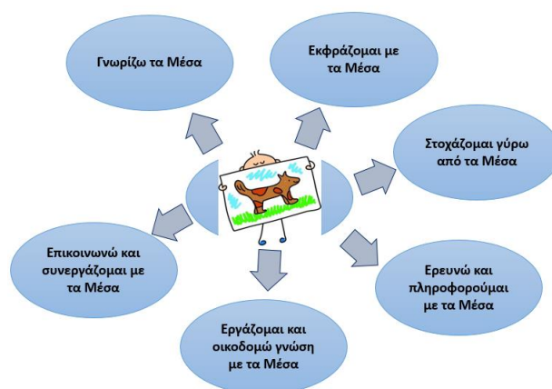
Σχήμα 1: Κατηγορίες στόχων εκπαιδευτικών παρεμβάσεων - Σοφός, 2015

Από την ανασκόπηση της διεθνούς βιβλιογραφίας (Sofos 2010) συμπεραίνεται ότι οι κατηγορίες στόχων της Εκπαίδευσης στα Μέσα που διατυπώνονται έχουν ποικίλα σημεία αναφοράς: α) τα αναλυτικά προγράμματα σπουδών που αναφέρονται σε δεξιότητες που θα πρέπει να αποκτήσουν οι μαθητές στο πλαίσιο της σχολικής τους εκπαίδευσης, π.χ. στο ΕΠΠΣ (1997) και το ΔΕΠΠΣ της Πληροφορικής (2003) για την πρωτοβάθμια εκπαίδευση, β) θεωρητικές προσεγγίσεις του μιντιακού γραμματισμού, π.χ. Baacke (1999), Aufenanger (1999), Tulodziecki (1997), Buckingham (2005), Μακράκης (2000), γ) πιλοτικά ερευνητικά προγράμματα πανεπιστημίων και άλλων φορέων, π.χ. (I Curriculum Partnership 2004), δ) εκπαιδευτικούς οργανισμούς και άλλες επιστημονικές ενώσεις, π.χ. (ISTE 2007). Με σημείο αναφοράς την ανάλυση των παραπάνω στόχων της Μιντιακής Εκπαίδευσης (Σοφός 2015) οι στόχοι της Εκπαίδευσης στα Μέσα συστηματοποιούνται σε έξι κατηγορίες στόχων για τον προσανατολισμό των εκπαιδευτικών παρεμβάσεων όπου τα Μέσα προσεγγίζονται ως δυνατότητες κριτικής διάδρασης στο βιόκοσμο των μαθητών: