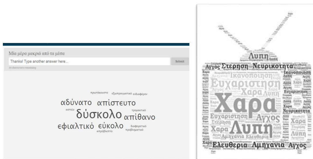
Εικόνα 2, 3: Συννεφολέξα μαθητών από τη δραστηριότητα «Μια μέρα χωρίς Μέσα»

Μερικά από τα παιδιά ανέφεραν πως δεν είχαν ιδιαίτερο πρόβλημα που δεν άνοιξαν τον υπολογιστή τους και πέρασαν τον χρόνο τους παίζοντας επιτραπέζια ή έξω στο χωριό. Με την τηλεόραση όμως, αν και αρκετοί προσπάθησαν, δεν τα πήγαν και τόσο καλά. Πιο συγκεκριμένα, αν και είχαν την θέληση, επειδή συνήθως η τηλεόραση στο σπίτι παραμένει για ώρες ανοιχτή, πολλοί από αυτούς δεν άντεξαν και αθέτησαν τον στόχο που είχαμε βάλει από κοινού. Γενικότερα εκφράστηκε η άποψη ότι είναι πολύ δύσκολο να περάσουν μία ολόκληρη μέρα μακριά από τα Μέσα. Αυτό ισχύει περισσότερο για την τηλεόραση και λιγότερο για τον υπολογιστή.